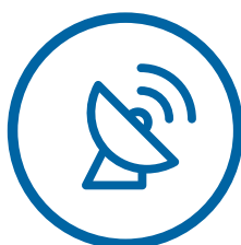
SALAS DE TRANSMISIÓN