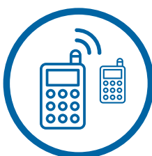
SALAS DE TELECOMUNI- CACIONES