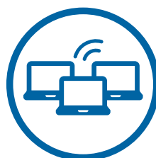
SALAS DE CONTROL