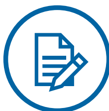
SALAS DE PRUEBA