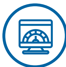
SALAS DE INSTRUMENTOS Y MEDICIÓN